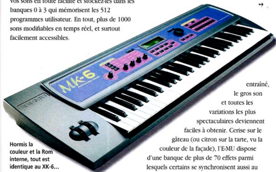
Hormis la couleur et la Rom interne, tout est identique au XK-6...

BPM. Du bout des doigts, on peut aussi programmer 4 commandes servant à la modification en temps réel de plus de 16 générateurs de sons synthétiques et les paramètres du filtre. Tout tombe si facilement sous les mains (pas forcément expertes) que le petit écran LCD n'affiche que 2 lignes de 24 caractères, et cela suffit amplement. Trois boutons changent l'affichage des menus :